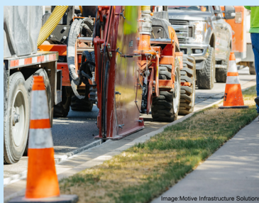
Corte de una zanja para el conducto de fibra.

Si tiene alguna pregunta sobre la construcción del proyecto FiberCity® llame al