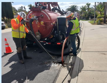
Localización de servicios públicos.

Las cámaras albergan importantes equipos de red. La imagen muestra la cámara en un estado temporal con asfalto negro alrededor y en un estado permanente una vez que la red esté completa.